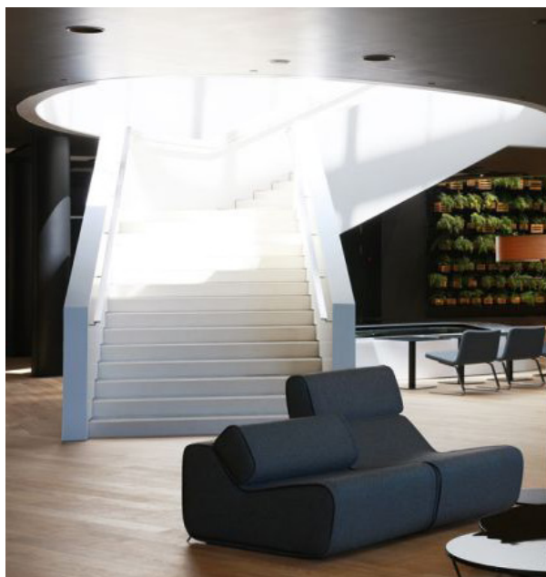
Stubište u konačnoj izvedbi

Specifični „Y“ tlocrt omogućio je racionalnu organizacijsku shemu, kvalitetan pogled iz svih soba i okupljanje svih javnih sadržaja oko centralnog lobija koji vertikalno povezuje sve etaže hotela. Na taj se način dobio prostor impresivne veličine i visine sa zanimljivim vizurama u kojem i oko kojega se odvijaju sve vitalne funkcije hotela.