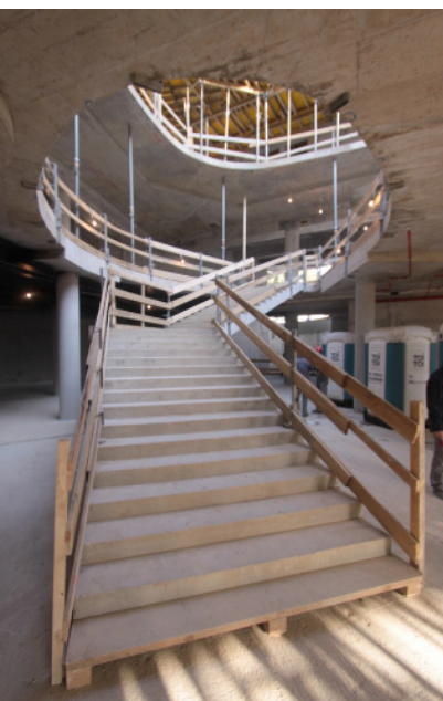
Stubište u izgradnji