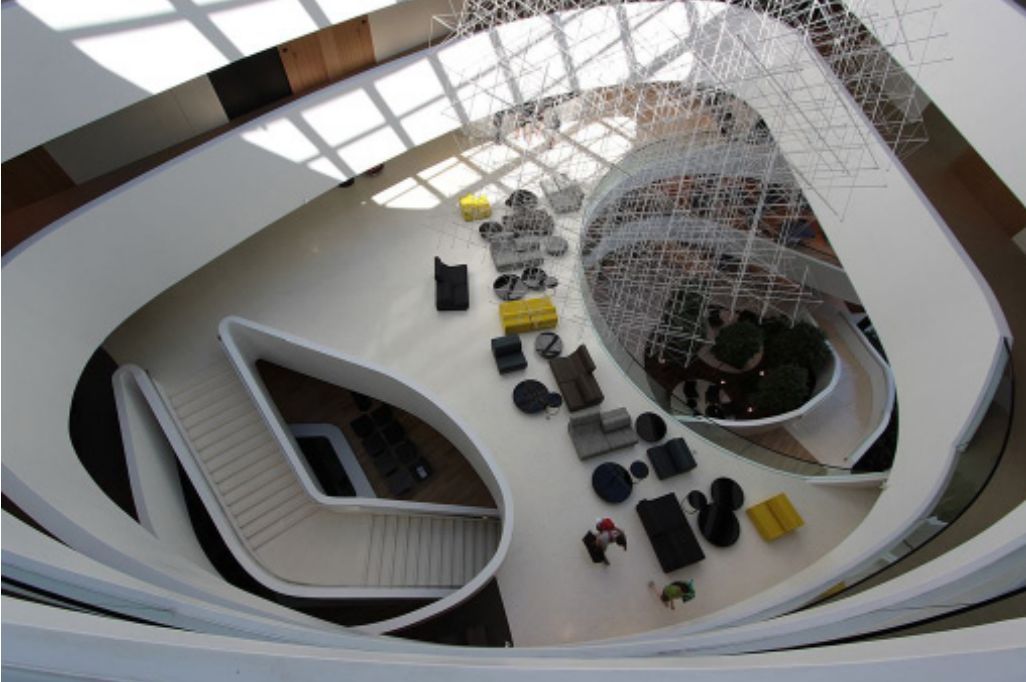
Iz ptičje perspektive