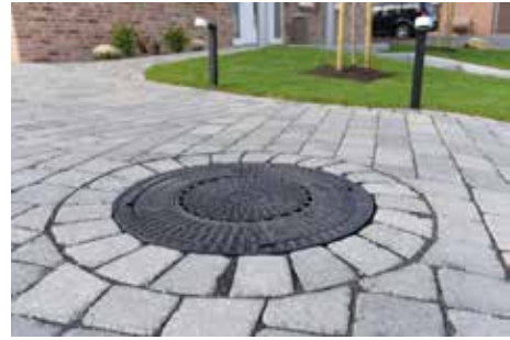
ACO SAKU kanalizacijski poklopac iz polipropilena za trajno lijep izgled.